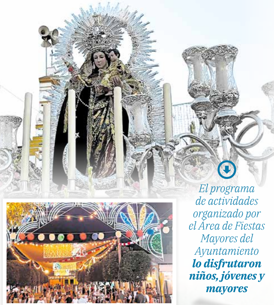
El programa de actividades organizado por el Área de Fiestas Mayores del Ayuntamiento lo disfrutaron niños, jóvenes y mayores